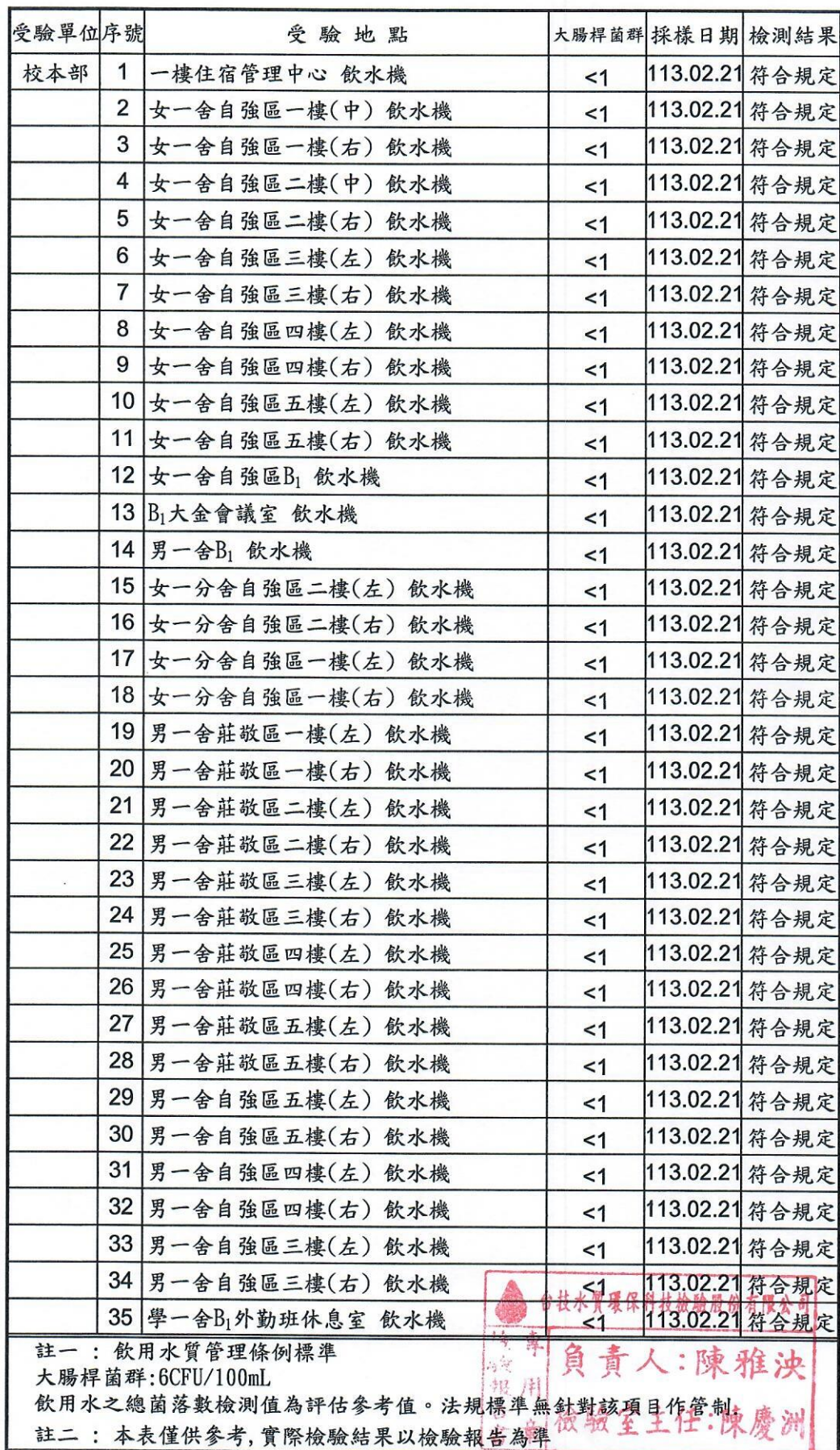
國立臺灣師範大學水質檢驗結果一覽表