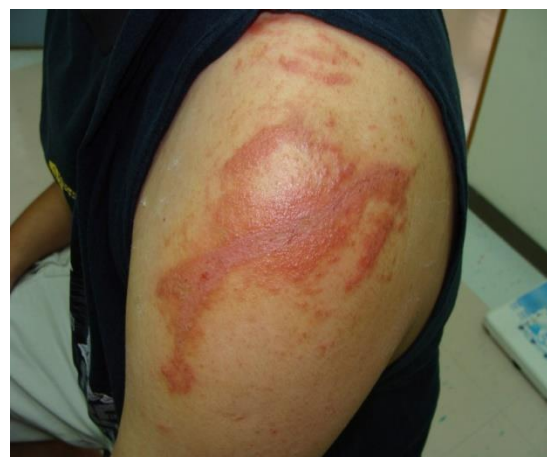
圖 常見的隱翅蟲皮膚炎