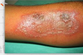
Figure from Dato, S.H.R., Bala, N., Rahman, S.B. 2006. Paederus dermatitis in Sarawak. Dermatology Online Journal 12(7): 9

會引發皮膚刺痛、 紅腫、水泡等症 狀。只要不打破 蟲體，這些隱翅 蟲素幾乎不會造 成人體危害