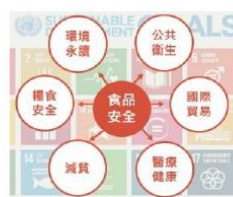
聯合國世界食品安全日